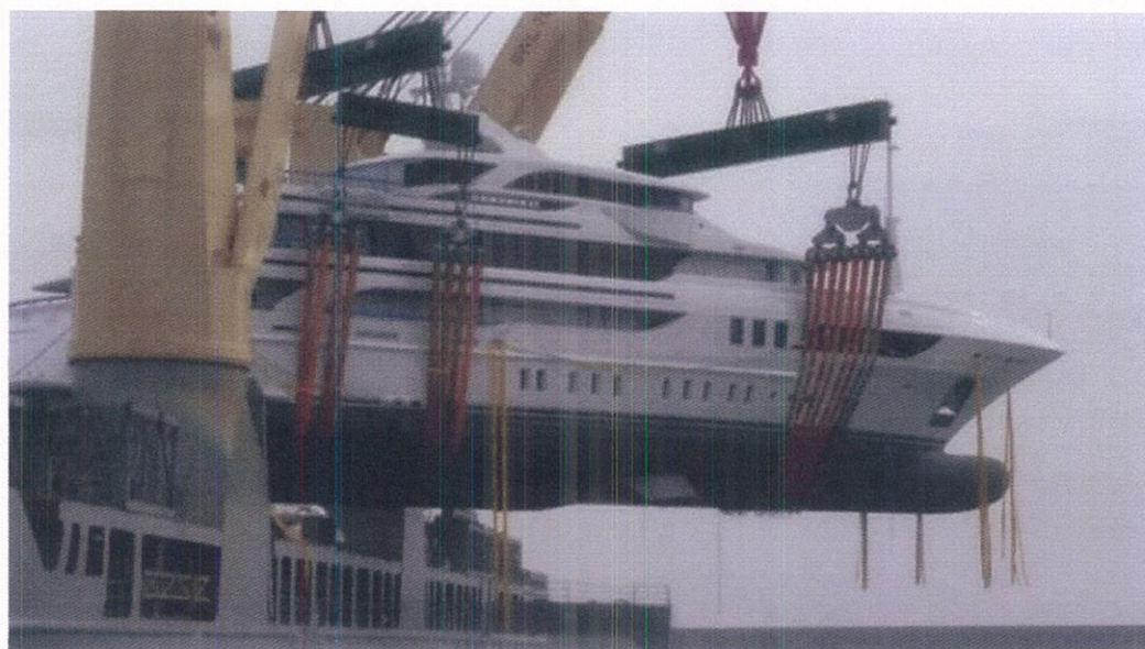
AIPERT - AIPAM "Predisposizione delle merci al trasporto" Genova , 5 Maggio 2017