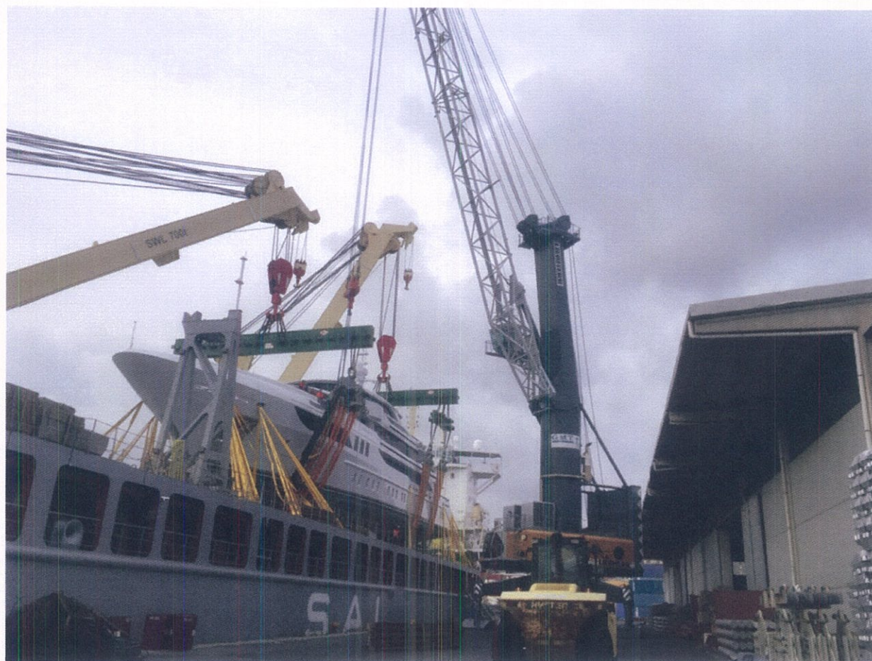
AIPERT - AIPAM "Predisposizione delle merci al trasporto" Genova , 5 Maggio 2017