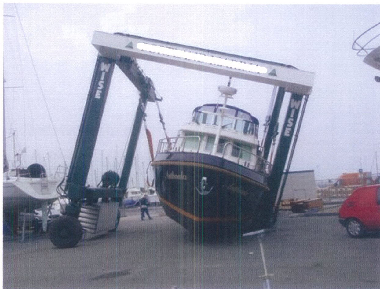
AIPERT - AIPAM "Predisposizione delle merci al trasporto" Genova , 5 Maggio 2017